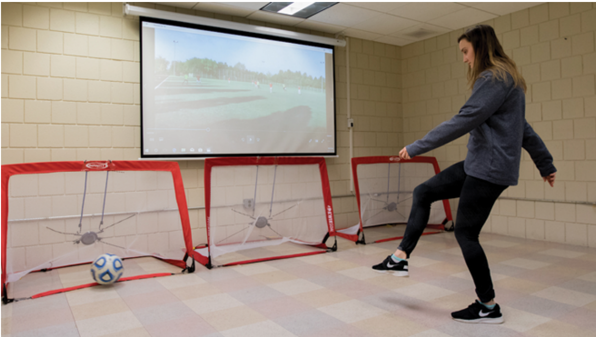
Figura 2. Ilustração do sistema NeuroTracker e seu uso no futebol.